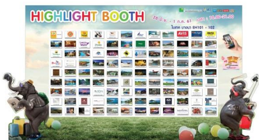
ตัวอย่างบอร์ดประชาสัมพันธ์ GOLD Package